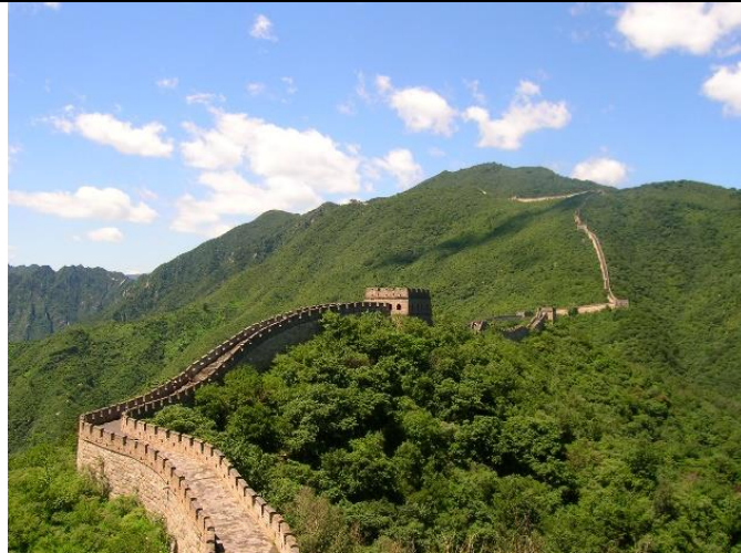
De Chinese muur

3. Vanuit de geschiedenis kennen we verschillende muren. Je ziet er hieronder drie staan: de Chinese Muur, de Berlijnse Muur en de Mexicaanse Muur van de Amerikaanse president Trump.