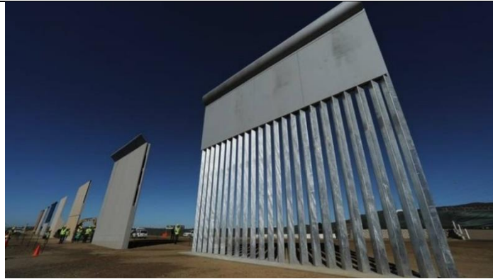
Muur van Trump